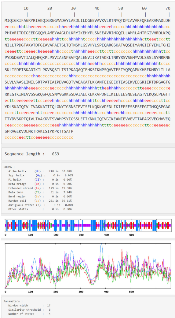
图 2 StkP 蛋白的二级结构预测